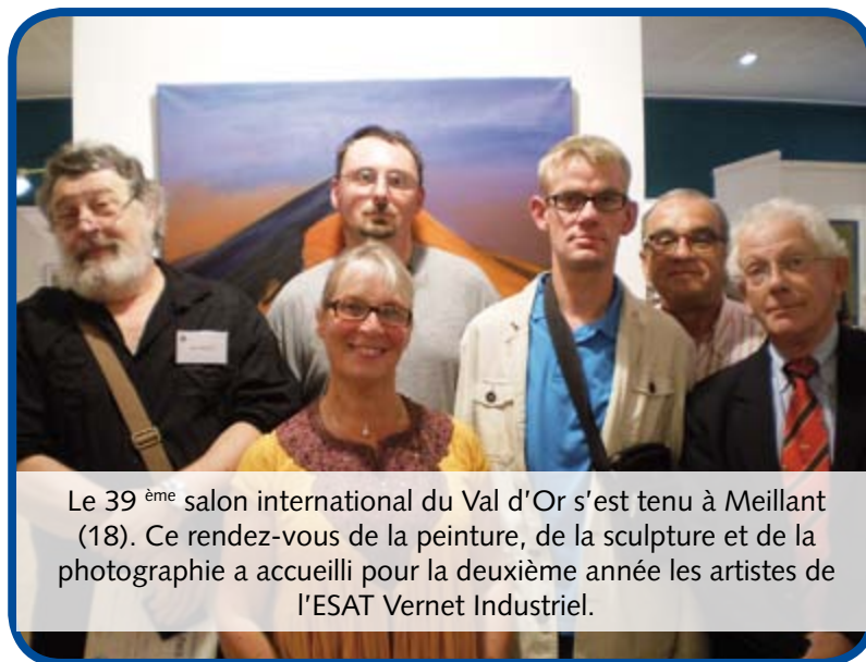
Le 39 ème salon international du Val d'Or s'est tenu à Meillant (18). Ce rendez-vous de la peinture, de la sculpture et de la photographie a accueilli pour la deuxième année les artistes de l'ESAT Vernet Industriel.