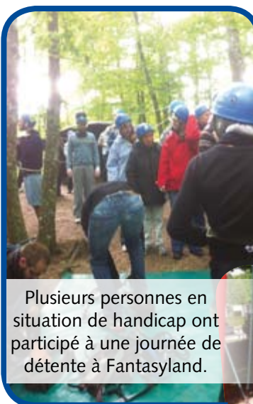
Plusieurs personnes en situation de handicap ont participé à une journée de détente à Fantasyland.