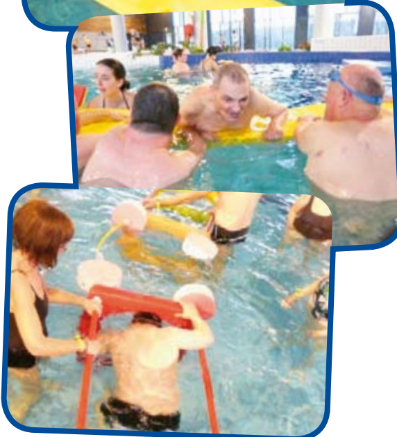
26 résidents du foyer de vie Bernard-Fagot s'adonnent toutes les semaines à la découverte du milieu aquatique.