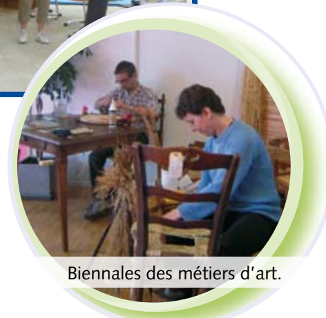
Biennales des métiers d'art.