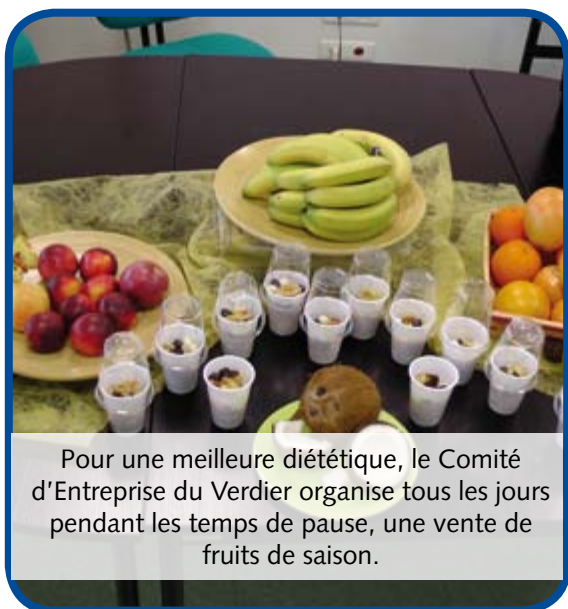
Pour une meilleure diététique, le Comité d'Entreprise du Verdier organise tous les jours pendant les temps de pause, une vente de fruits de saison.