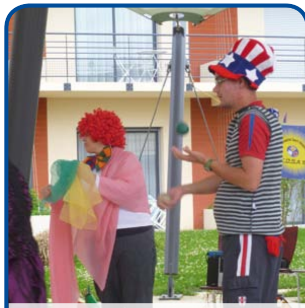
Trois foyers d'hébergement du département se sont donnés rendez-vous aux foyers Bernard-Fagot pour participer à une journée festive organisée par le CDSA (Comité Départemental de Sport Adapté).