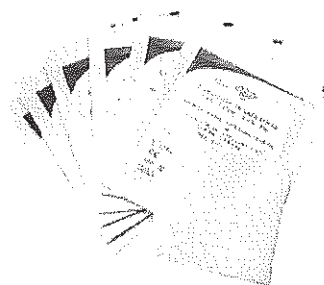
30 x 30 cm

Descriptif : Compresse de gaze hydrophile stérile Qualité 12 plis – 17 fils Emballage individuel